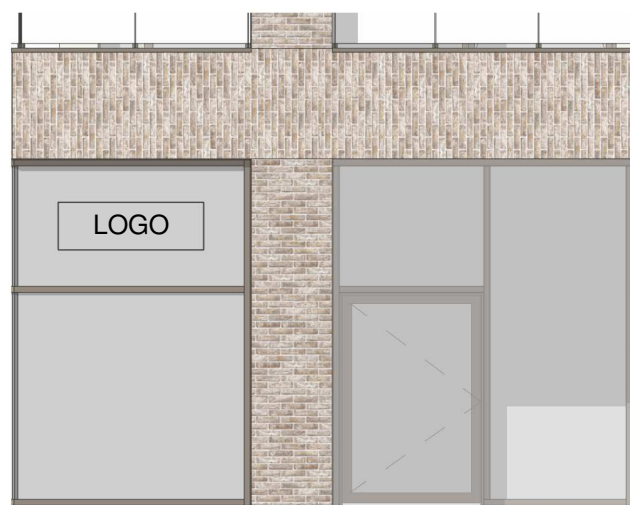
2 ELEWACJA POŁUDNIOWO-WSCHODNIA