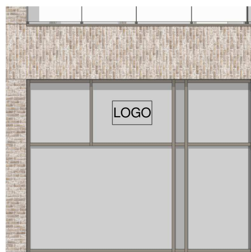
1 ELEWACJA POŁUDNIOWA